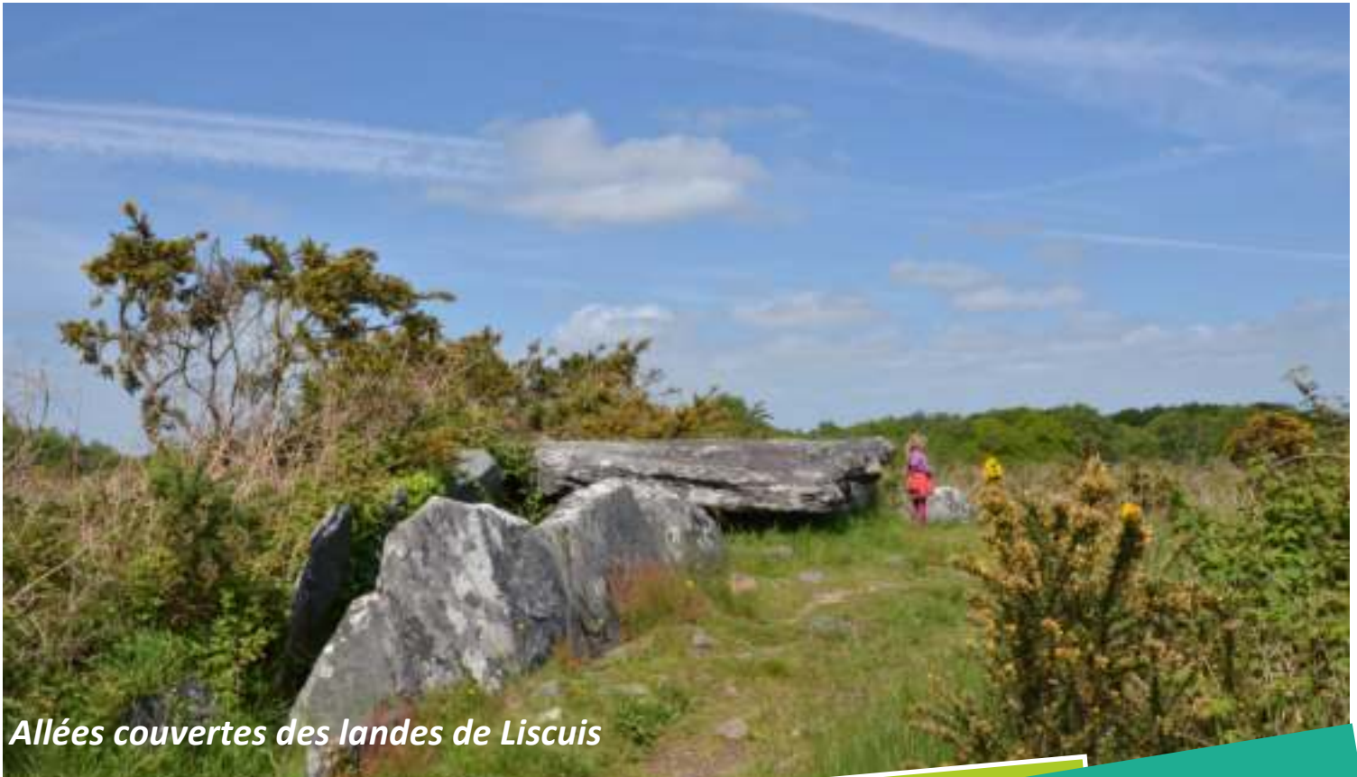
Allées couvertes des landes de Liscuis

Un pays où la grande Histoire et les petites histoires se rencontrent.