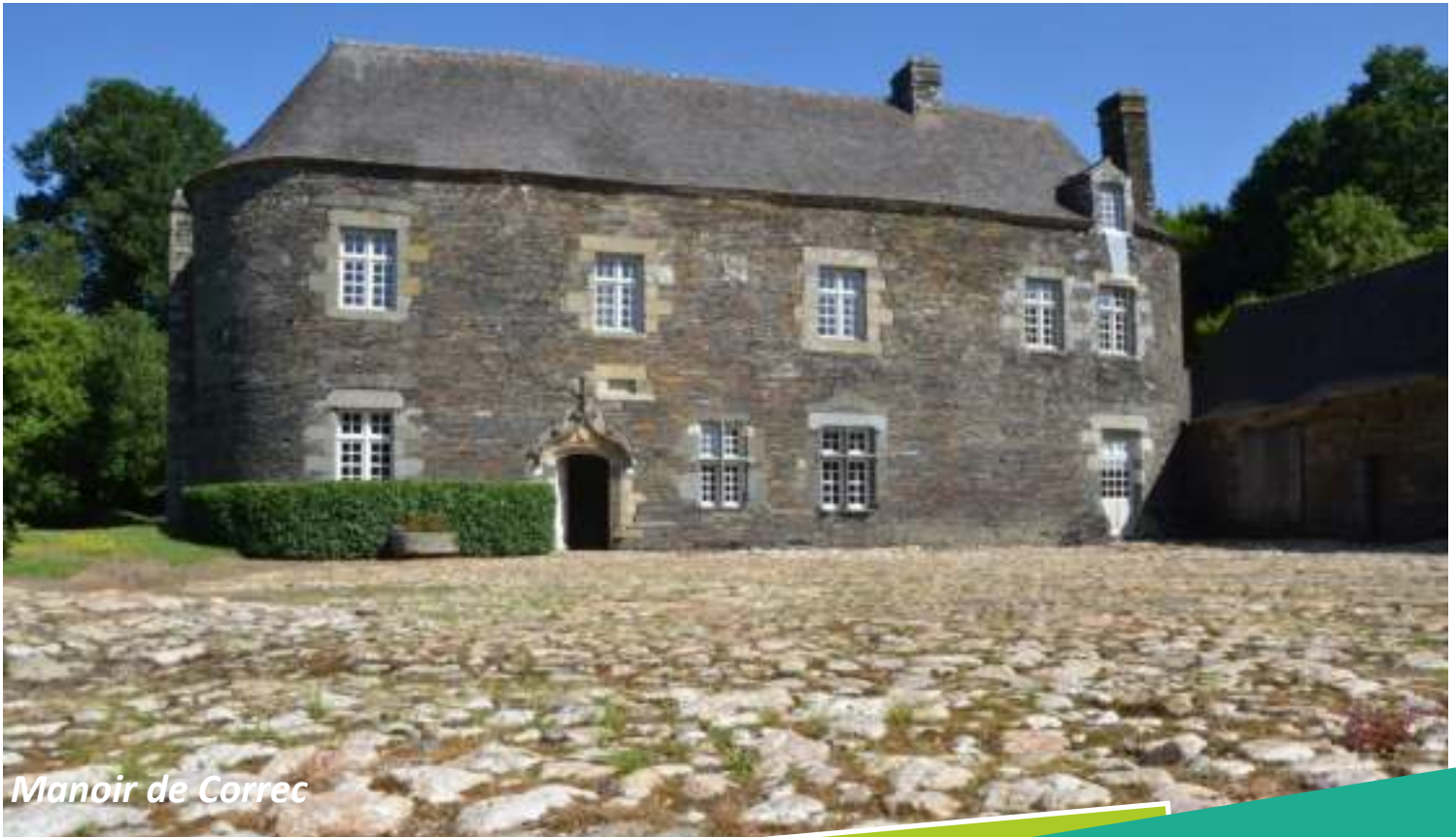
Manoir de Correc

De manoir en abbaye... chaque site affiche avec fierté son originalité et son caractère et invite à parcourir la riche culture du cœur de la Bretagne.