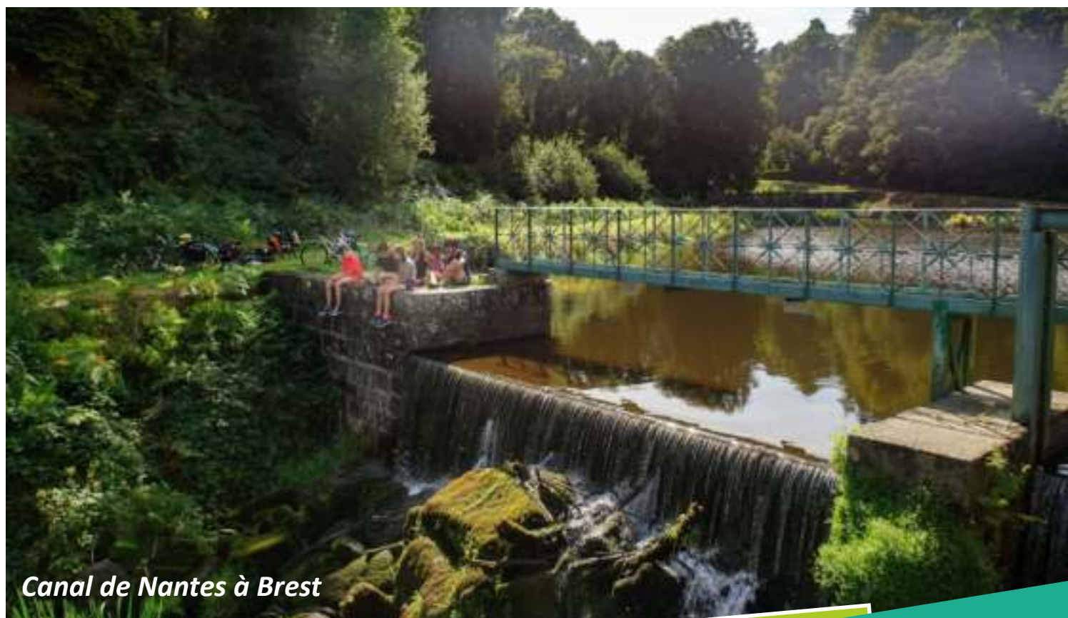
Canal de Nantes à Brest

Le canal de Nantes à Brest est la colonne vertébrale du Centre-Bretagne. Ce long ruban d'eau qui a traversé les siècles a permis de relier les territoires.