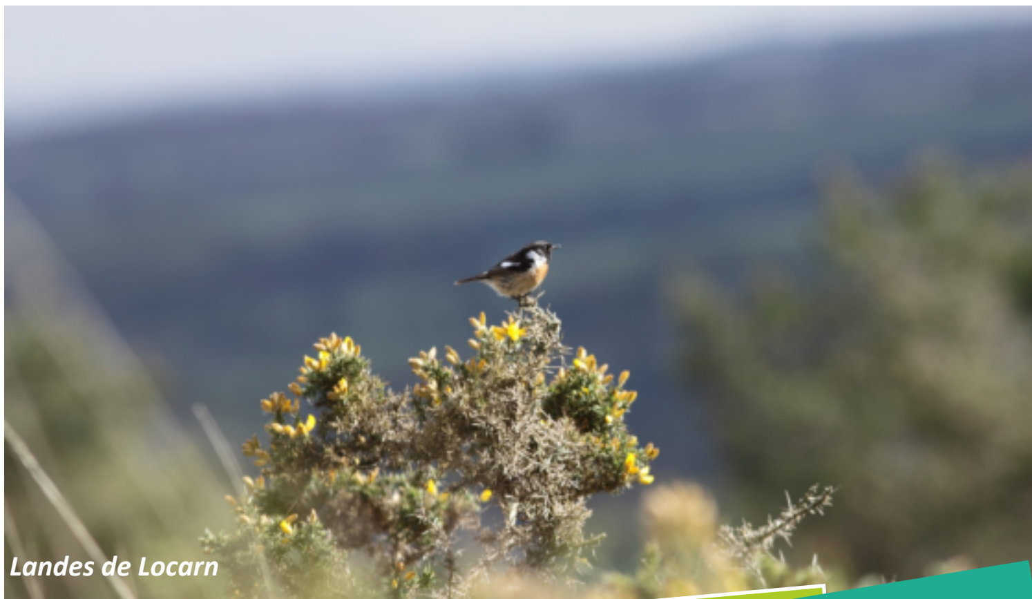
Landes de Locarn

Arpentez les chemins creux et les étendues sauvages... Venez fouler les terres du Kreiz Breizh, et ajoutez-y l'audace de la Bretagne.